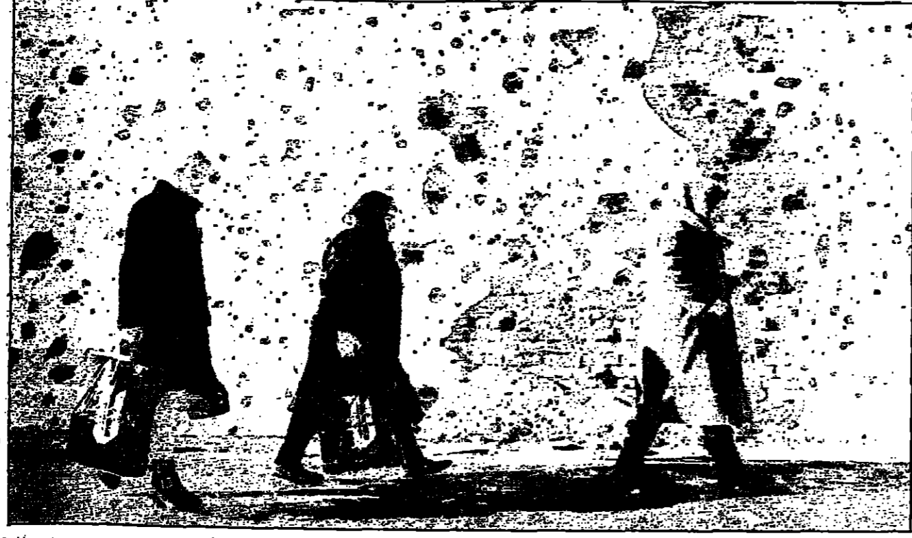
سيدات في مدينة غروزني يسرن بجانب جدار تظهر عليه اثر المارك العنيفة التي شهدتها المدينة